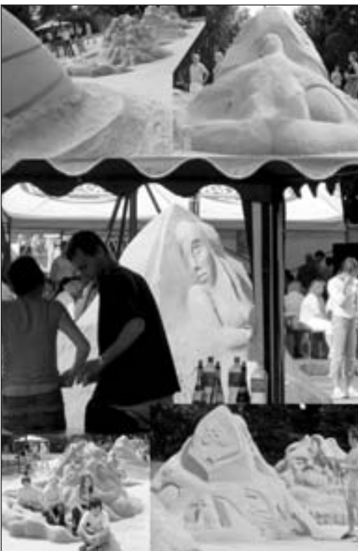
Fotky z prvního ročníku akce.

Chceme navázat na úspěšný první ročník soutěže vytváření soch z písku jinde v České republice nekonaný. Podobné akce se dělají již v mnoha přímořských městech světa (Haag, Blankenberg), ale i ve vnitrozemí (Moskva). Zahajujeme tradici, která by se v dalších letech opakovala.